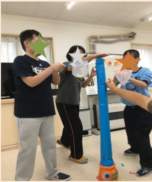
※ふわふわおさかなキャッチゲーム 筒の上から飛び出したお魚たちを網で上手にキャッチ！！