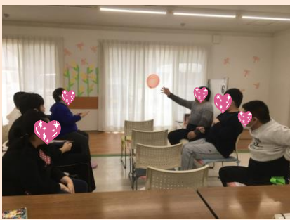
※風船バレー大会 2チームに分かれてラリー！ 皆、陣地に落とさないように頑張っています！