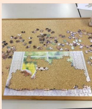
※みんなで協力してパズルも作成！