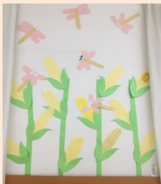
※ 季節ごとの装飾を制作し、施設壁に貼っています