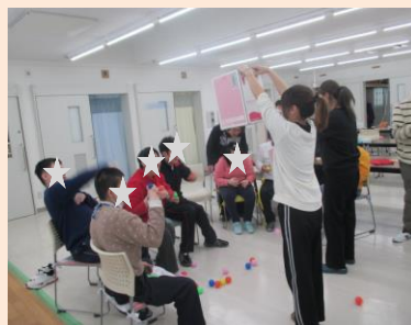
※ボールを入れられないように箱を持って動く職員VS うまく狙ってボールを入れる利用者さんたち！！