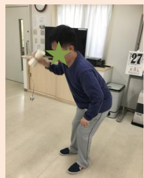
※職員手作りの紙コップけん玉で、うまくできるかな？