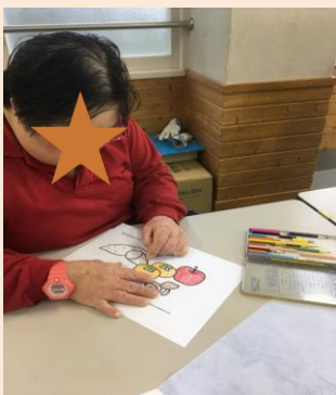
※ 制作：10月のカレンダー